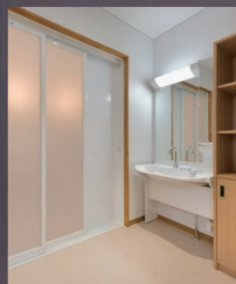
▲洗面・脱衣所 (2人部屋)