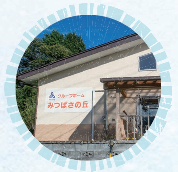
グループホーム みつばさの丘