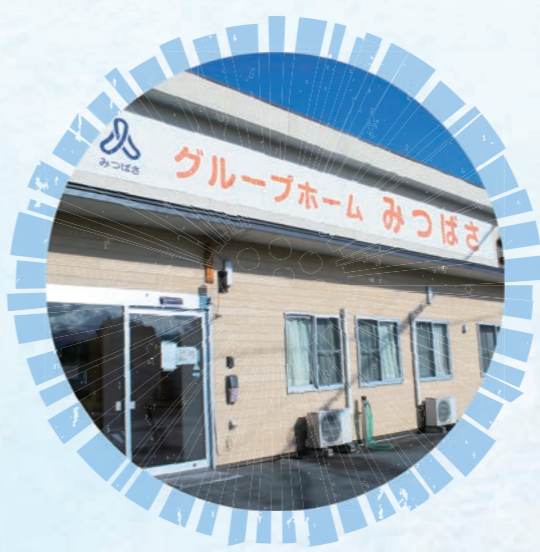
グループホーム みつばさ