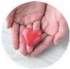
精神科訪問看護対応